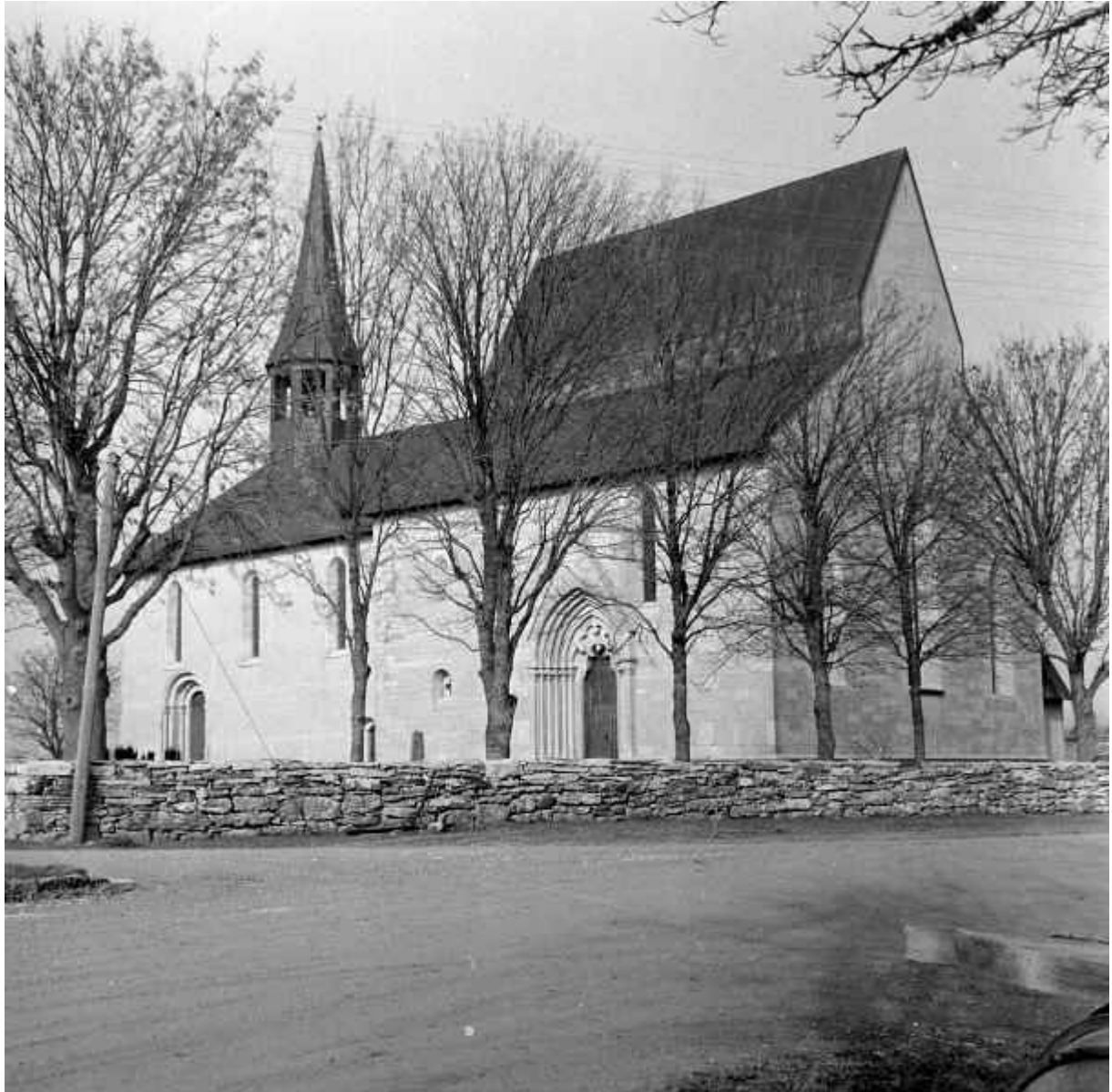
Från RAÄ. Lau kyrka. Foto: Iwar Andersson 1961.

86 år efter första bilden är kyrkan genomgripande restaurerad. För att äntligen bli av med problemet med läckande tak, har man lagt på kopparplåt, ett för Gotland totalt främmande takmaterial. Korets tak har ändrats till den förmodade medeltida takformen, jfr När och Roma. Takryttaren har fullständigt förnyats. Putsade partier har fått cementputs med glimmer i. Även kyrkogårdsmuren ser ut att ha lagats, en del stenar lyser vita och nya. Restaureringen av kyrkan leddes av arkitekten Åke Porne på ett mycket bestämt sätt. Invändigt omgestaltades kyrkan nästan fullständigt, ett mycket kontroversiellt arbete som på den tiden inte uppskattades av församlingen.