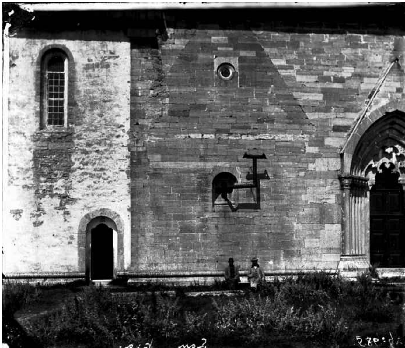
Från RAÄ. Parti av Lau kyrkas södersida. Foto: Carl Fredrik Lundberg 1875.

Denna mycket gamla bild visar flera intressanta saker: Dels kyrkan med hårt slitna fasader, underhållet är uppenbarligen eftersatt. Ur det lilla fönstret, som tillhörde ett tvärkor till det äldsta koret från 1220-talet, sticker det ut ett vinklat järnrör, vilket kastar en skugga på väggen. Troligen var järnröret skorstenen till en kamin inne i kyrkan. En onekligen drastisk lösning på uppvärmningsproblemet!