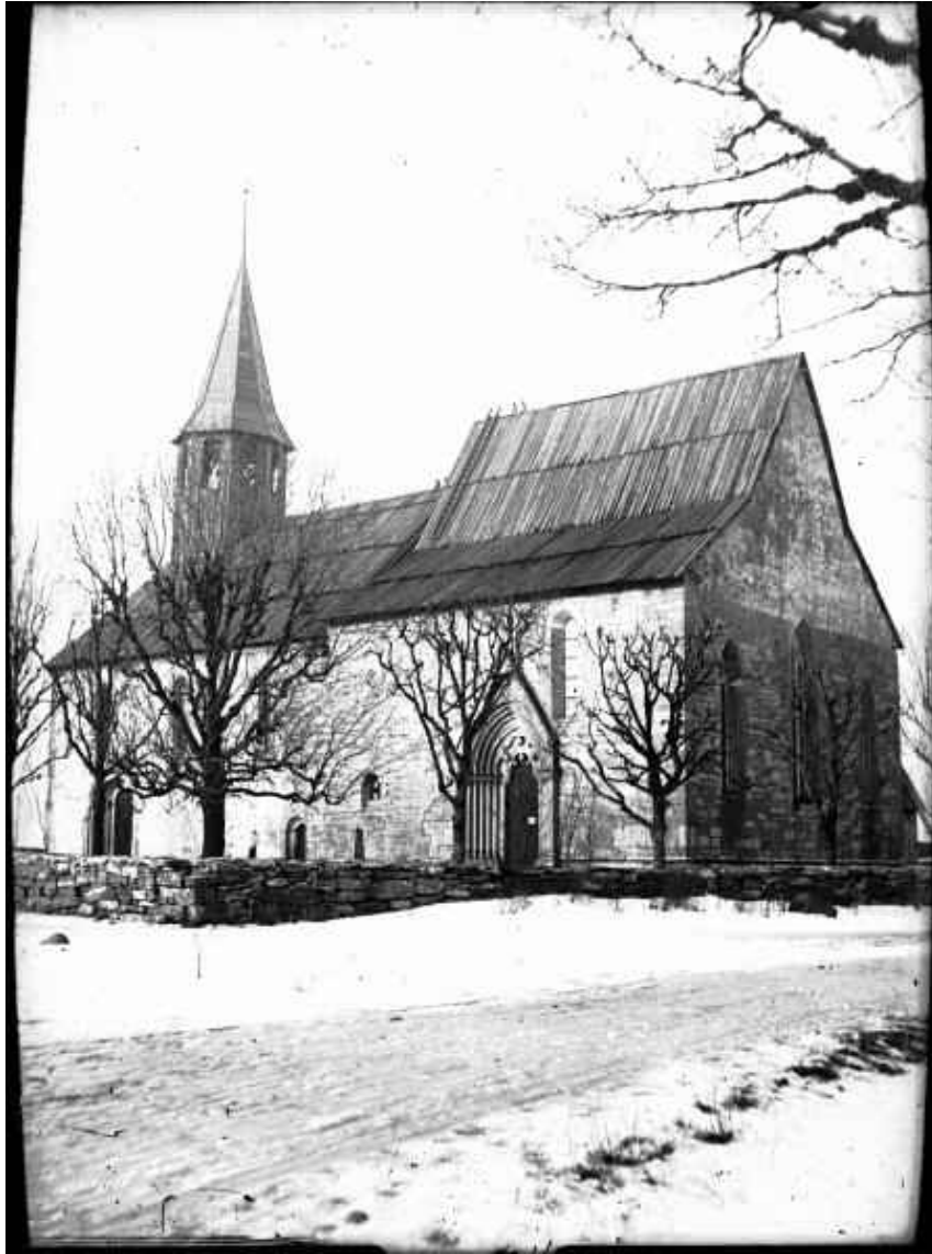
Från RAÄ. Lau kyrka. Foto: Einar Erics 1915.

Det har gått 40 år sedan förra bilden. Träden vid kyrkogårdsmuren har vuxit rejält. Kyrkan ser dessvärre ut att ha förfallit. Mer puts verkar avflagad. Faltaket på koret är riktigt dåligt, det måste läcka som ett såll!