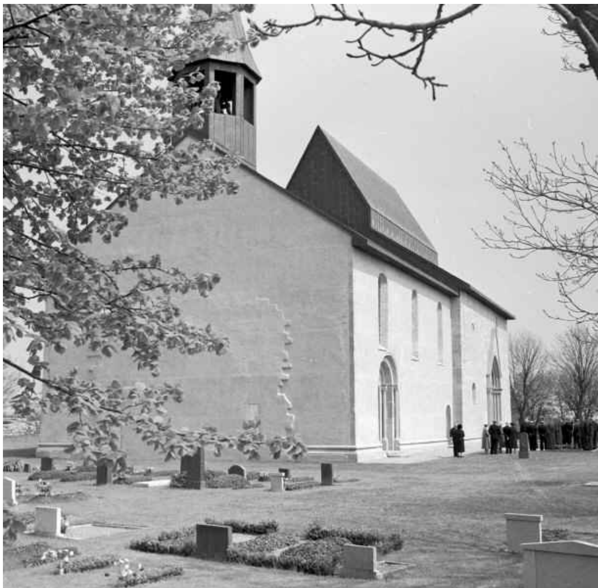
Från RAÄ. Lau kyrka från sydväst. Foto: Selling 1961.

Här ser vi en bild av kyrkans västgavel och sydsida efter restaureringen. Den igensatta tornbågsöppningen syns tydligt, men den nya ritsen som markerar valvöppningen framträder inte. Den upphöjda delen av kortaket syns däremot tydligt. Dess form och den inplåtade gaveln blev inte uppskattade av sin samtid. Däremot tyckte man att den nya takryttaren blev finare än den gamla.