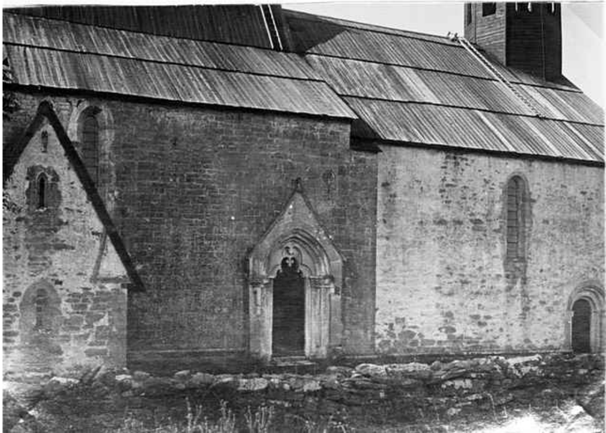
Från M. Klintbergs fotosamling. Lau kyrkas norra fasad. Foto: Masse Klintberg 12 juli 1917.

Vi ser här norra sidan av kyrkan, vars fasader är ganska slitna av väder och vind. Skillnaden är störst mot hur det ser ut idag på sakristians och långhusets väggar. Egentligen är väggarna mera spännande på bilden än dagens tjockt putsade fasader. Faltaket ser också ganska slitet ut, det höll knappast tätt vid denna tidpunkt. Masse har tagit bilden från kullen av den ännu outgrävda prästgårdsruinen.