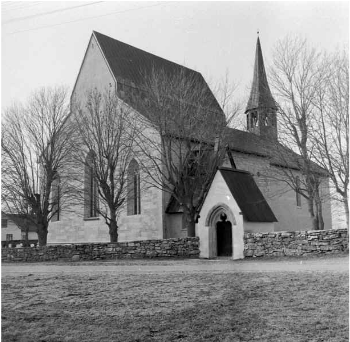
Från RAÄ. Lau kyrka från öster. Foto: Iwar Andersson 1961.

Här ses gaveln och kyrkans norra sida med sakristian skymtande bakom Brudluckan, den östra stigluckan. Kyrkan är nyrestaurerad och prydlig, liksom Brudluckan. Träden är stora och har klappats (hamlats) flera gånger. Bilden är tagen från Kluckartäppu.