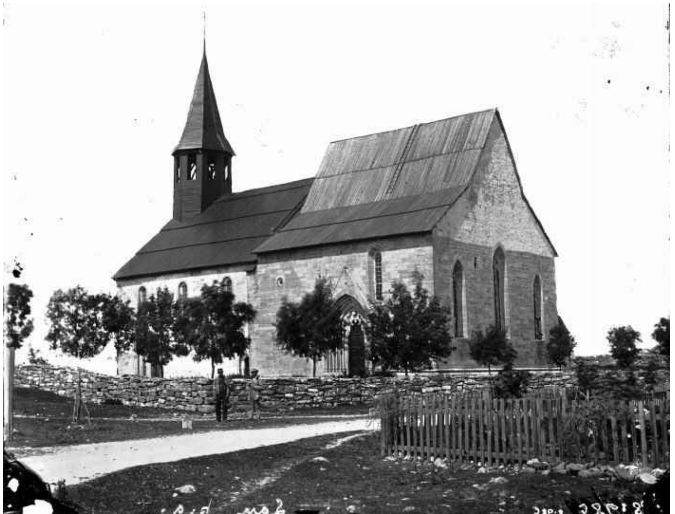
Från RAÄ. Lau kyrka. Foto: Carl Fredrik Lundberg 1875.

Det är sällsynt med bilder från Gotlands landsbygd som är tagna så här långt tillbaka i tiden. Kvaliteten är utmärkt och vi kan se flera saker. Kyrkan tycks på det här avståndet vara i hyfsat skick. Långhustaket och takryttaren är nytjärade, medan kortaket ser mer taget ut. Här ser man dess äldre takform och hur ryttaren såg ut förr. Putsen är nog rätt sliten. Kyrkogårdsmuren verkar vara av samma utseende som idag, men backen upp mot stigluckan t v alldeles utanför bild förefaller vara brantare. Träden är ännu rätt små, de planterades 1844 efter ett beslut på kyrkostämman. Sockenborna skaffade fram trädplantor och skolmästaren och bonden Lars Ahlström planterade dem mot betalning. Längst t h ovanför muren skymtar en kulle, det måste vara Kastalbacken, se under Lau prästgårdsruin.