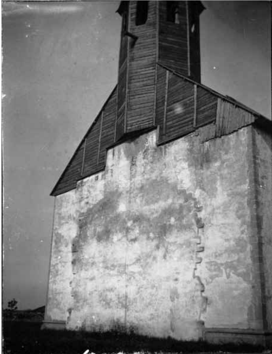
Lau kyrkas västgavel.

Johnny Roosval var den som utforskade Gotlands kyrkor, systematiserade dem och la grunden till all den kunskap vi har om dem idag. Han var verksam på fältet alldeles i början av 1900-talet och kom ut med sin epokgörande bok om gotländska stenmästare 1918. Bilden bör vara tagen före detta år.