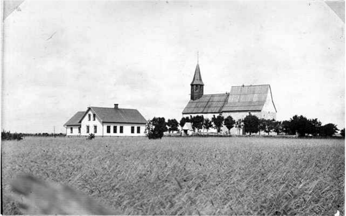
Från M. Klintbergs fotosamling. Lau skola och kyrka. Foto: Masse Klintberg 18 aug 1902.

Detta är en klassisk bild av Masse Klintberg. Masse har gått ut i rågåkern och tagit denna bild det första året han fotograferade. I det öppna landskapet syns den 5 år gamla skolan i sitt nya läge framför kyrkan, förr stod skolhuset t h precis i bildens kant öster om kyrkans kor. Kyrkan framträder monumentalt, men döljs delvis av de 60 år gamla träden runt kyrkogårdsmuren. Kyrkan har ännu den äldre takryttaren och den äldre takformen med faltak, se bilder och texter längre fram. Ser man noga, upptäcker man små figurer uppe vid taknocken. Kan det vara barnungar som klättrat upp på taket för att kolla vad fotografen har för sig?